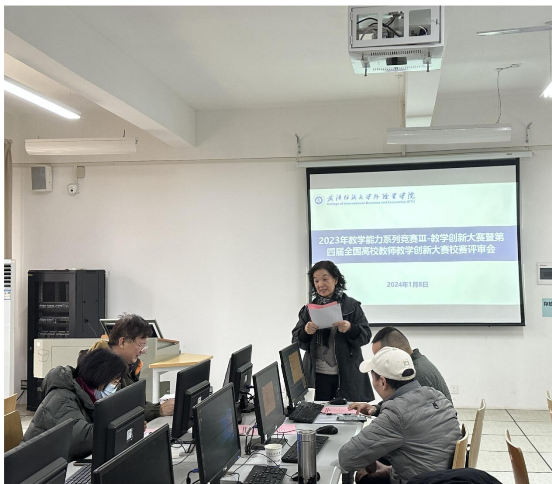
图为2024年1月8日教学创新大赛校赛评审组专家组

本次教学创新大赛分为学院（课部）推荐、学校校赛二个阶段进行，校赛由网络评审和现场评审两部分组成。自竞赛通知发布以来，各学院（课部）积极组织符合条件的教师报名参赛，最终推选出8位教师（团队）入围校赛。经学校资格审查，副高组、中级及以下组二个组别共有6位选手入围现场汇报环节。在此环节，参赛选手围绕课程设计、教学改革与创新情况进行汇报，并对评委质疑进行了答辩。各位评委从选手的教学理念与目标、教学设计与创新、教学过程与方法、考评与反馈等维度进行评审。