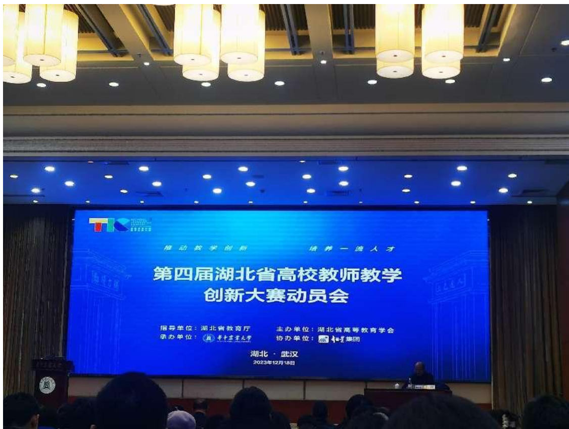
图为第四届湖北省高校教师教学创新大赛动员会现场

为深入学习贯彻党的二十大精神及习近平总书记关于教育的重要论述，落实立德树人根本任务，助力我校课程思政建设、新工科、新文科建设，推动信息技术与教育教学融合创新发展，根据中国高等教育学会《关于举办第四届全国高校教师教学创新大赛的通知》（高学会〔2023〕108号）文件精神，我校于2023年11月启动教学能力系列竞赛Ⅲ-教学创新大赛暨第四届全国高校教师教学创新大赛校赛工作。